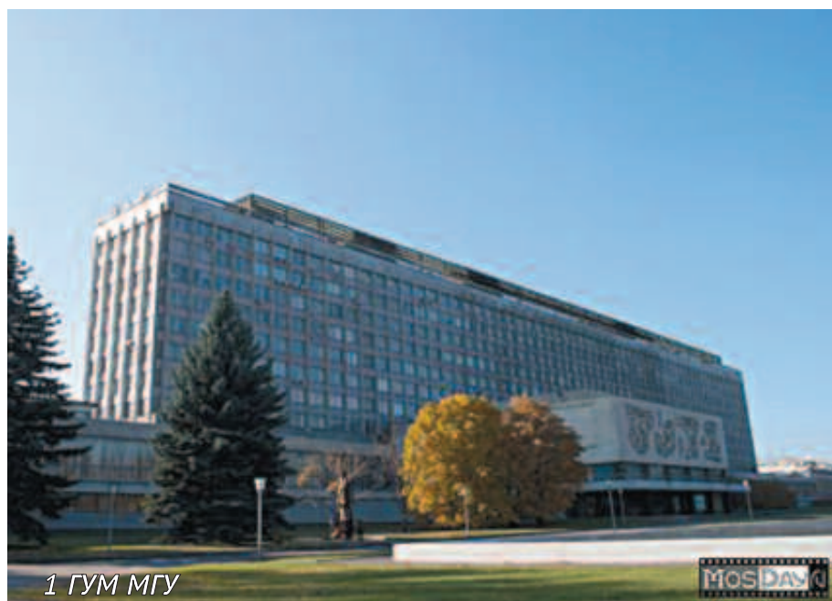
1 ГУМ МГУ

Люди – существа зависимые, и зависят они от всего: от семьи, любви, работы, даже от климата и места жительства. Даже в одной профессии мы разные, ведь учимся и живем разной жизнью, учимся в разных местах, впитываем в себя разную информацию. Оглянитесь и вы не найдете двух одинаковых юристов!